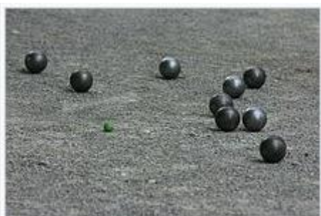
Spielszene mit Boulekugeln