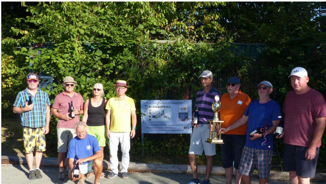
Die Siegerehrung in Biebortal.

Biebortal/Heuchelheim/Wettenberg (ws). Drei Jahre fand kein Turnier mehr um den Bürgermeisterpokal statt. Nun spielten wieder Dreier-Mannschaften (Triplettes) aus Biebortal, Wettenberg und Heuchelheim um den Bürgermeisterpokal.