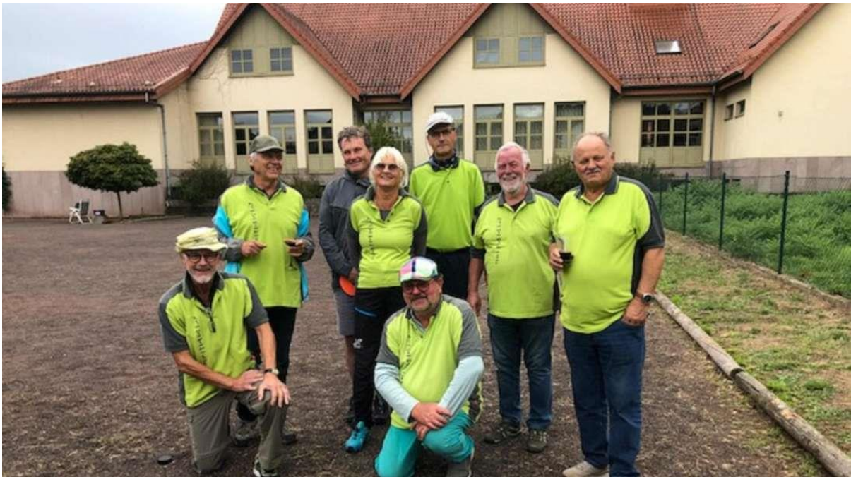
Meister und Aufsteiger: Das Team von »BouleBiebertal«.

»BouleBiebertal« steigt als Tabellenerster mit fünf Siegen und 15 Spielpunkten in die dritte Hessenliga auf, gefolgt vom Mitaufsteiger SV Ronshausen mit fünf Siegen und neun Spielpunkten.