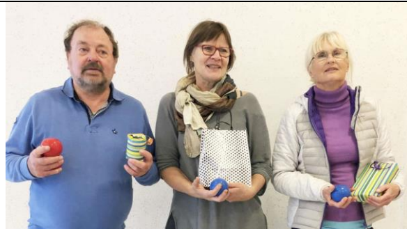
Die drei Erstplatzierten beim Indoor-Boule.