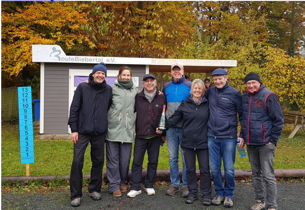
Die Hessenmeister vom 30. Oktober 2021

Am 2. November 2021 Von Eveline Renell In Bieber , Biebertal , Sport , Sportnachrichten , Veranstaltungen